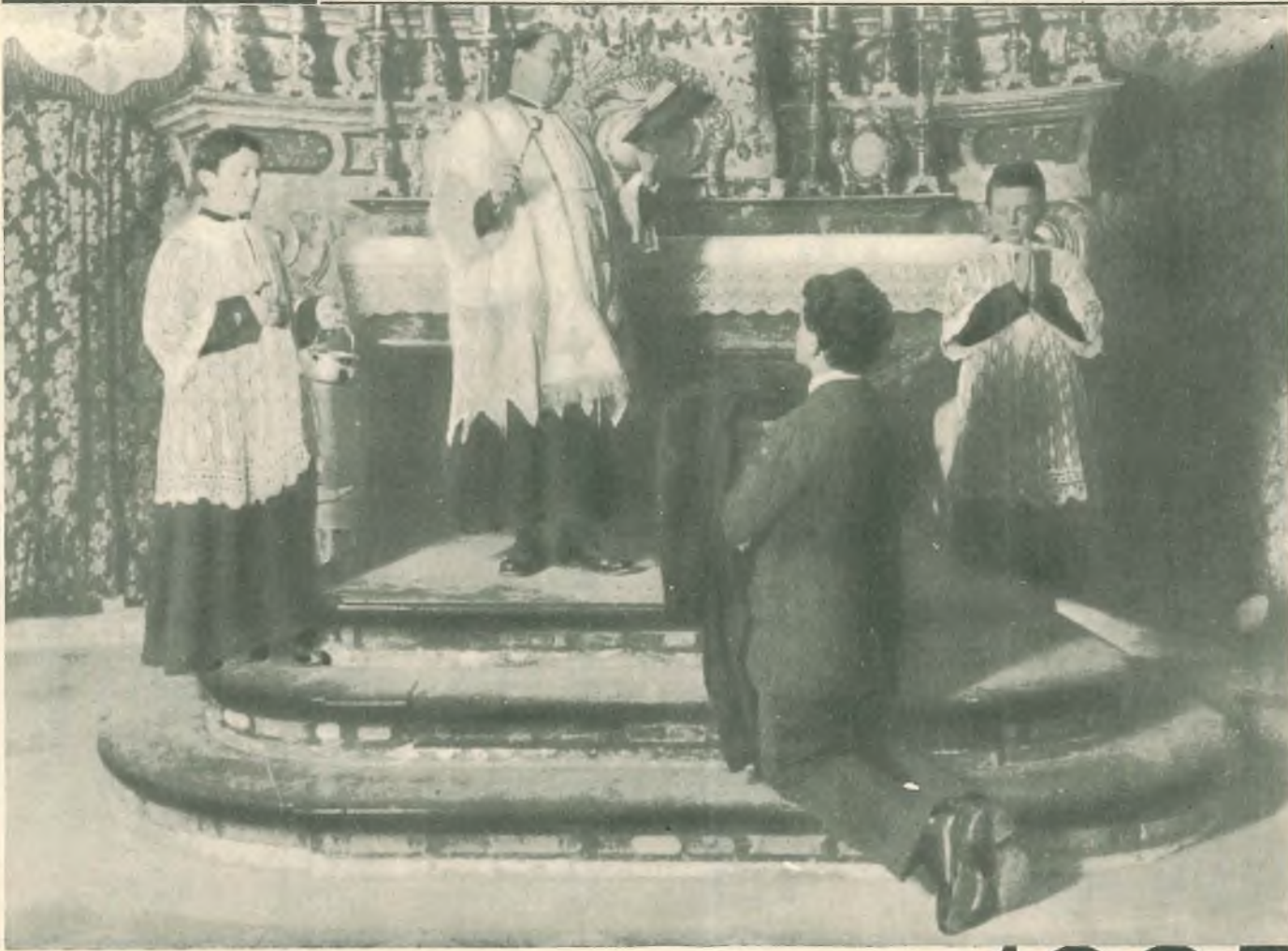
Giovanni Bosco, a 20 anni, veste l'abito sacerdotale