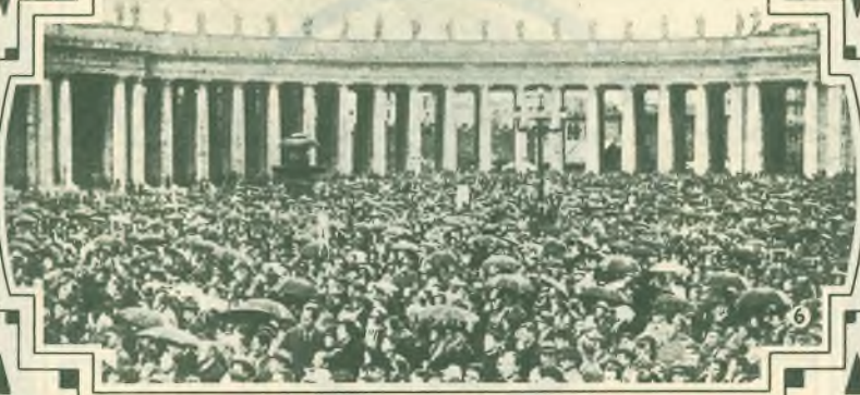
6. Folla in piazza S. Pietro.

Facciamoci coraggio a patire per amor di Dio; chè se ci riempiamo di allegrezza il pensare alla grandezza del premio celeste, non ci deve atterrire quanto soffrir dovremo per andarne al possesso... Facciamo del bene, mentre siamo in tempo; se poi nel lavorare per la gloria di Dio ci toccherà sopportar fatiche e tribolazioni di qualsiasi genere, diciamo con S. Paolo: Ciò che soffro è cosa di un momento; ma il premio che Dio mi darà in Cielo durerà in eterno.