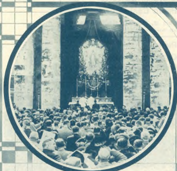
3. Prima messa d'un Salesiano sulla Piazza San Pietro durante il rito della Canonizzazione. 4. (a destra) S. E. il M. Perosi dirige la "Sistina".