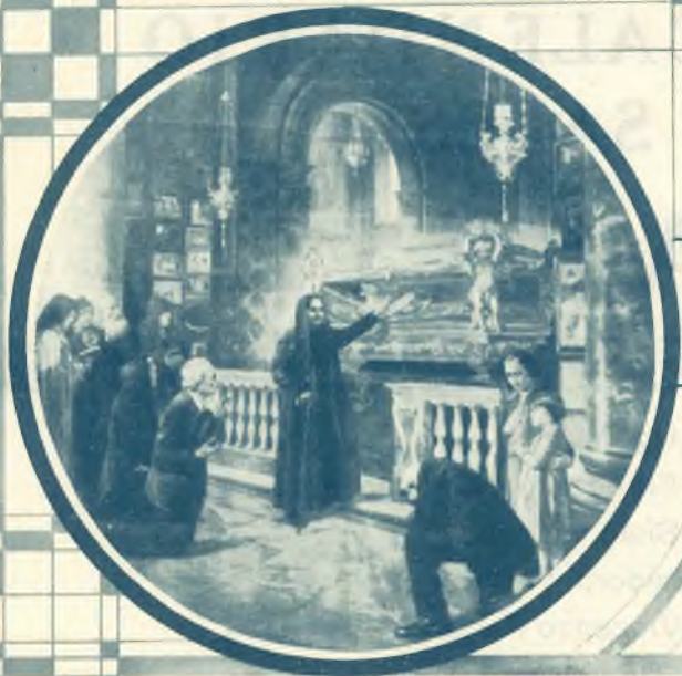
1. Uno dei Miracoli della Canonizzazione.