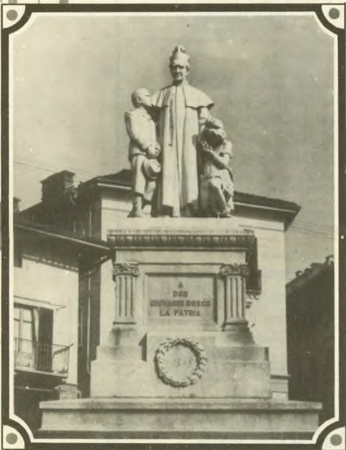
2. Castelnuovo Don Bosco - Monumento.