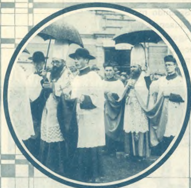
3. Sfilano i Prefetti Apostolici Salesiani. 4. (a destra) In rappresentanza delle Case Salesiane... una lunga teoria di giovani.

Ascrivendosi alla Pia Opera del Sacro Cuore di Gesù in Roma col versamento di una sola lira italiana, una sola volta, si partecipa al frutto di sei Messe al giorno, duemilacentonovanta all'anno e in perpetuo.