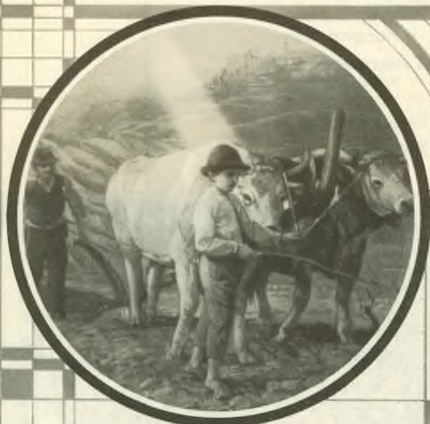
3. I primi maestri di Don Bosco fanciullo: Il lavoro, la povertà e la sofferenza. - 4. (a destra) I "Becchi" di Castelnuovo - La Borgata dove il Santo ebbe i natali.

Le Missioni si possono aiutare con le adozioni . Per le adozioni si corrispondono annualmente: Per un sacerdote . . . . . L. 2000 per un catechista . . . . . L. 500 per un chierico aspirante . . . L. 1000 per un bambino . . . . . L. 300 per un seminarista indigeno . L. 500 per il riscatto di uno schiavetto L. 300 per l'imposizione del nome ad un bambino . . . . L. 25