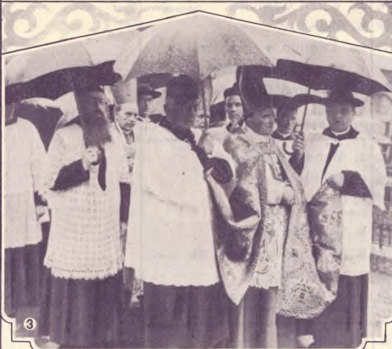
1. Nel cortile. Folla devota che segue la funzione trasmessa dagli altoparlanti. — 2. Ordini Cavallereschi alla Processione trionfale. — 3. I Vescovi Salesiani sfilano nella Processione. — 4. La lunga teoria dei Vescovi sfilano incurante della pioggia.