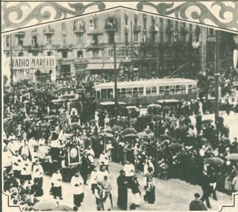
1. Don Bosco Santo festeggiato a Novara. — 2. Il trionfo di Don Bosco Santo a Verona. — 3. Omaggio di Milano a Don Bosco Santo. — 4. Faenza. Folla osannante a Don Bosco Santo.