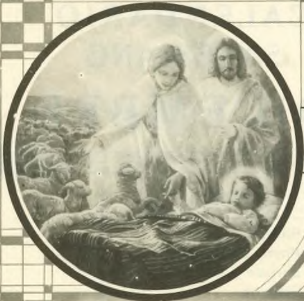
1. L'infanzia del Santo - Sogno rivelatore.