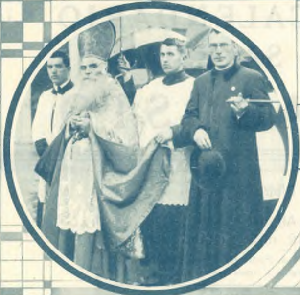
1. Particolari della Processione di Torino - Un Vescovo Missionario.