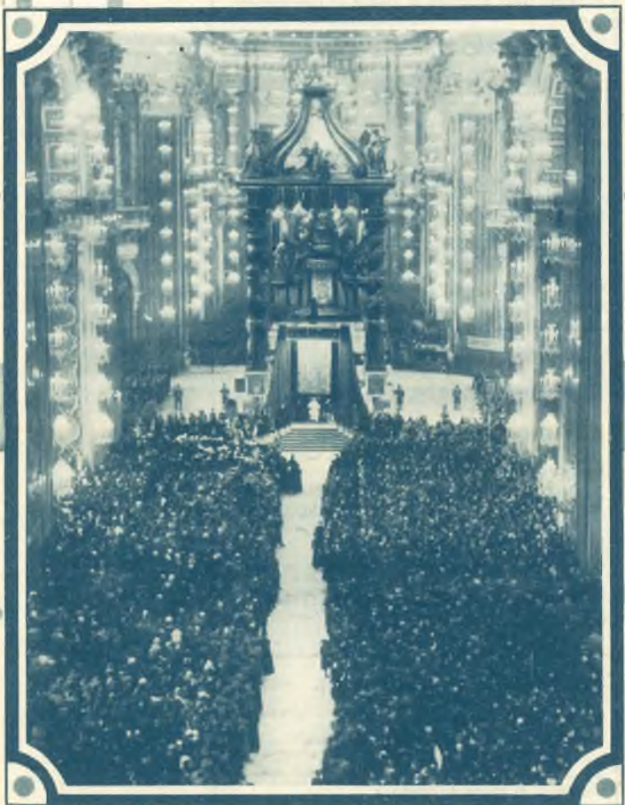
2. L'udienza del Santo Padre alla famiglia Salesiana nella Basilica di S. Pietro.