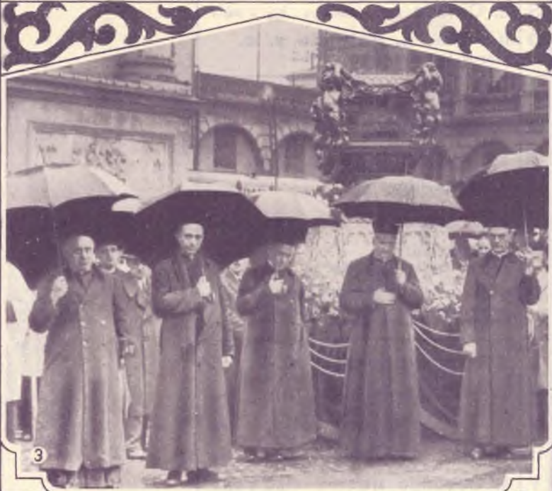
1. La Processione si avvia. — 2. S. E. il Cardinale Maurin, Primate delle Gallie, esce dal Tempio. — 3. Il Capitolo Superiore della Società Salesiana. — 4. L'omaggio dei bambini delle Scuole Comunali.