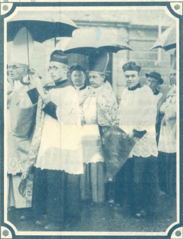
2. Continua la sfilata dei Vescovi.